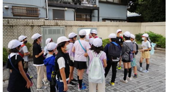
《蔵の町川越を見学する4年生》

9～10月は、全学年がバスを利用した校外学習の予定が入っております。普段の学校生活とは違った体験をすることができますし、友達と協力し合う機会ともなります。実施の何日も前から、楽しみにしている子どもたちも大勢いますし、宿泊のある高学年は様々な準備を進めることが求められます。保護者の皆様にもいろいろと準備に御協力をいただき、感謝しております。