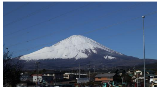
《雲一つない富士山の雄姿に希望を込めて》

さて、昨年の11月から12月にかけては、4年に一度のワールドカップサッカーが開催され、優勝経験のある強豪2か国を破って決勝トーナメントに進出した日本チームの活躍に日本中が湧きました。1993年のドーハの悲劇以前の日本にとって、「ワールドカップ」はただの夢でしかありませんでした。その日本チームが優勝経験チームを破った出来事は4年間の思いではなく、ワールドカップサッカーに参戦しはじめた1954年から70年近くも挑戦してきた結果だと思ふと感慨深いものがありました。「やればできる」と勇気を与えられた人も多かったことと思います。決して諦めないあの粘り強さを、これから育っていく子どもたちに身に付けさせるために今年も教育活動に邁進していきたいと強く願ひます。